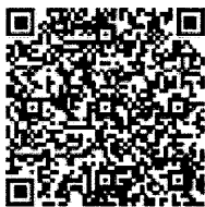
หลักสูตรย่อย ๑๔,๐๐๐ บาท