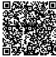
เต็มหลักสูตร ๒๗,๐๐๐ บาท