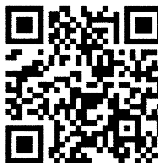
QR code ลงทะเบียน