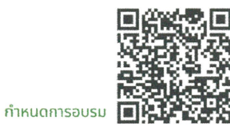
กำหนดการอบรม