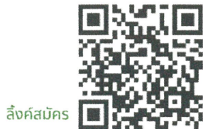
ลิงค์สมัคร