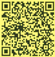
QR Code กำหนดการ

ณ ห้องประชุมอรรถสิทธิ์ เวชชาชีวะ ชั้น 5 อาคารสิริภคินี คณะแพทยศาสตร์โรงพยาบาลรามาธิบดี มหาวิทยาลัยมหิดล