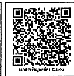
เอกสารข้อมูลสมัคร IC2wks