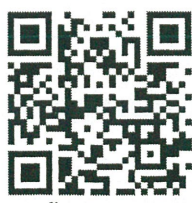
สมัคร IC2wks '69