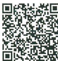
เอกสารข้อมูลสมัคร IC2wks