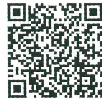
Line OA : สมาคม ICN